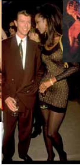
Iman en Bowie bij het begin van hun relatie.