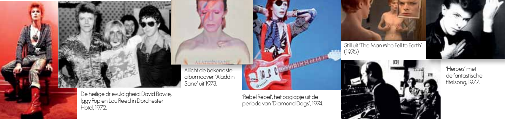
De heilige drievuldigheid: David Bowie, Iggy Pop en Lou Reed in Dorchester Hotel, 1972.