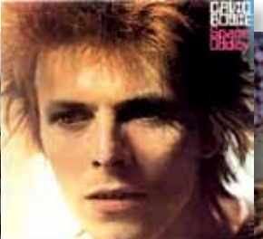
1969: 'Space Oddity', het eerste succes.