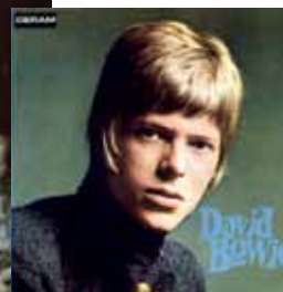
'David Bowie', het debuut uit 1967.

David - Robert Jones - Bowies muzikale carrière begon nochtans redelijk in mineur. Vanaf zijn vijftiende speelde hij in verschillende blues- en folkbands, zonder enig succes. Zijn eerste album onder zijn nieuwe naam, 'David Bowie' (1967), werd nauwelijks opgemerkt, maar enkele jaren later wist hij met zijn eerste hit en gelijknamige album 'Space Oddity' wél de aandacht van enkele muziekcensenten te trekken. Het was 1969, het jaar van de maanlanding en enkele maanden na de release van Stanley Kubricks '2001, A Space Odyssey'. Bowies aanvankelijke hippiestijl - denk zalmroze, velours pantalon met olifantenpijpen, jersey hemd met bloemenprint en lang, wild haar - ruimde plaats voor een meer buitenaardse look. Major Tom noemde hij zichzelf, een fictieve astronaut die door het heelal reist. Voor de hand liggende interpretaties over het alter ego werden pas in 1980 in het nummer 'Ashes to Ashes' bevestigd. 'Ashes to Ashes / funky / We know Major Tom's a junkie / strung out in heaven's high / Hitting an all-time low.'