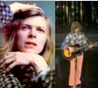
Bowies eerste live tv-optreden, tijdens de Ivor Novello Awards in 1970.